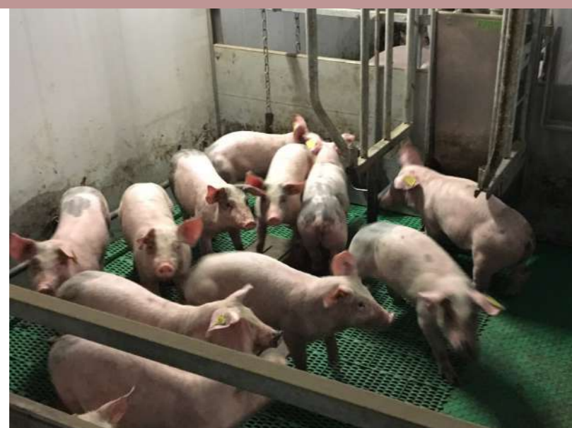
Spécialement conçu pour l'Organic F-2-W.