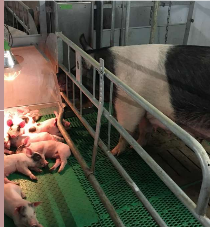
Système de pointe F-2-W pour les truies en stabulation libre.

Le sevrage signifie non seulement la séparation d'avec la truie, mais aussi le passage définitif d'un régime "lacté" à un régime alimentaire. Nos systèmes Farrow-to-Wean permettent aux porcelets de rester dans l'enclos après le sevrage et sont préparés à la maternité libre de la truie. Ils permettent également une "alimentation familiale" où la truie apprend aux porcelets à manger des granulés d'aliments. Avec les systèmes Farrow-2-Wean, il n'y a plus besoin de stress physiologique au sevrage !